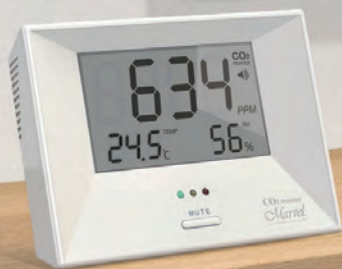
■マーベル 001 / 003

長期間使用時にも、測定誤差の生じにくい 高精度光学式 NDIR デュアルビームセンサーを使用