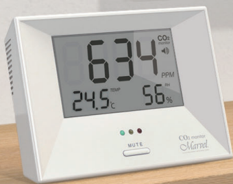
■マーベル 001 / 003

長期間使用時にも、測定誤差の生じにくい 高精度光学式 NDIR デュアルビームセンサーを使用