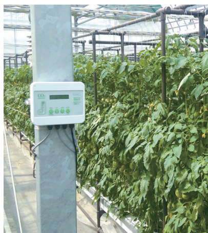
千葉大学 柏の葉キャンパス 三菱ケミカルアグリドリーム 植物工場内