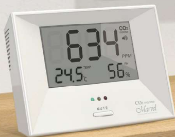
■マーベル 001 / 003

長期間使用時にも、測定誤差の生じにくい 高精度光学式 NDIR デュアルビームセンサーを使用